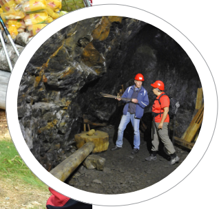
I en av gruv- gångarna vid Hornkullen.