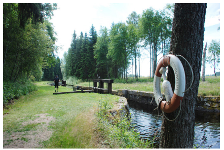
Vandring på Kanalbanken