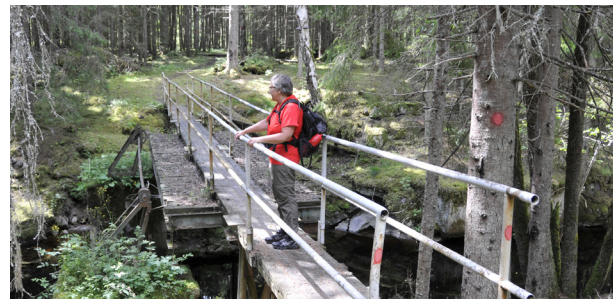
På väg över Prästbäcken