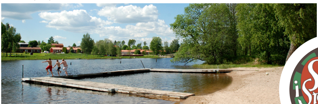
Badplats vid Badsta Camping