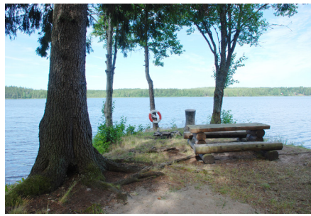
Källsfallet vid sjön Aspen