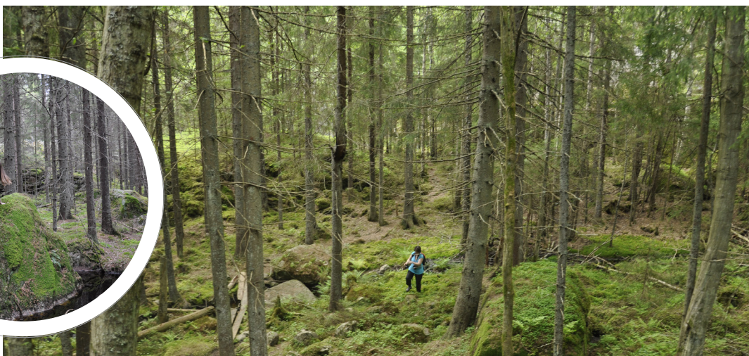
Gammelskog kring Rövarbäcken