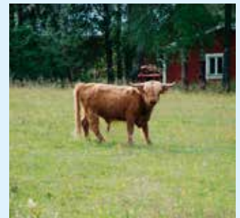
Kor längs promenadvägen.