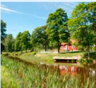
Café vid Bjurbäckens slussar.