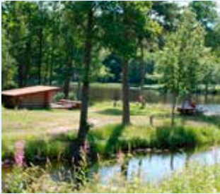
Rastplats vid Bjurbäcken.

Kort, lätt vandring från Bjurbäckens slussar till Asphyttans sluss