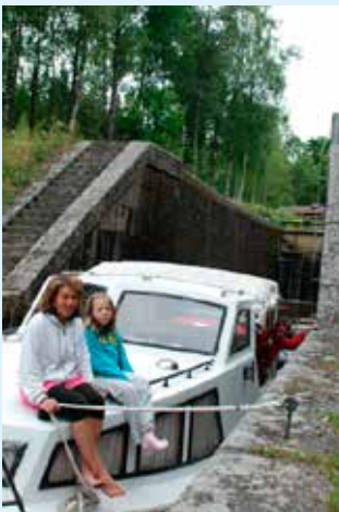
Slussning i Bjurbäcken.