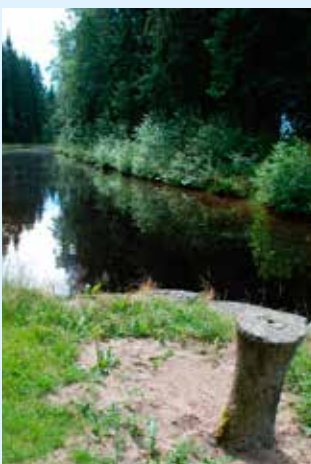
Promenadstråket längs kanalen är lätt och rofyllt att gå.