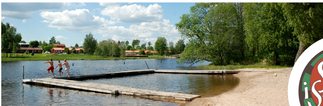
Badplats vid Badsta Camping