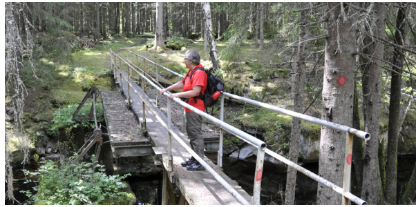
På väg över Prästbäcken