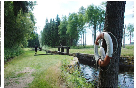
Vandring på Kanalbanken