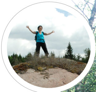
På hygget nedanför Rövar- kulorna