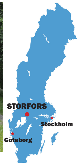
STORFORS Stockholm Göteborg