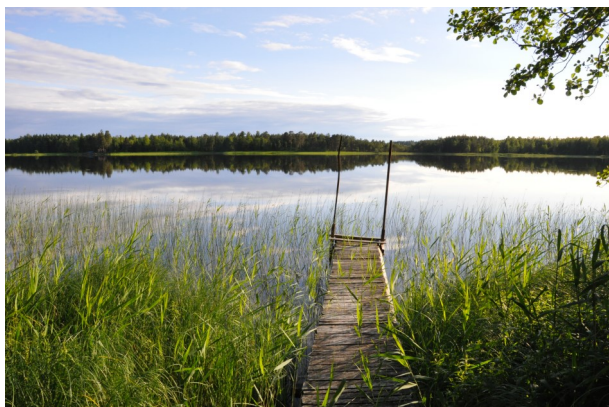
4. Sjön Ullvettern från Stegelviken. Här finns båtplats för Bjuröns fritidshusförening.