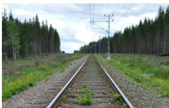
3. Över in-landsbanans räls måste cykeln ledas.