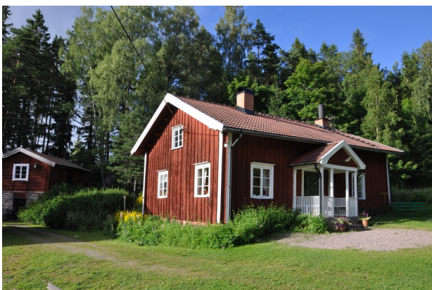
6. Titta in vid Börjes hembygdsgård. Ta gärna den gamla vägen norrut mot Storfors.