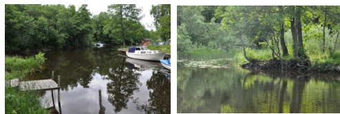
1. Gör en avstickare till Storfors småbåtshamn.