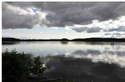
2. Skåda ut över Öjevettern vid Udden.