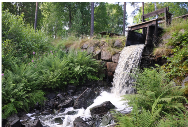
5. Vid Åsjöhyttan finns rester av en hytta och kvarn. Bord och bänkar för medhavd fika finns vid dammen.