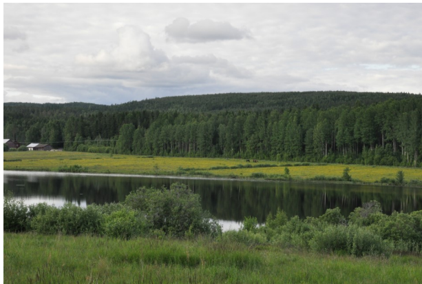
7. Ta höger för vägen runt Baggtjärn eller fortsatt rakt fram, över vägen och kom in i Storfors vid OK.