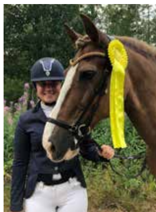
18-åriga Roddan kom på tredje plats i SM-B-finalen i ponnydressyr.

som är en Welsh Cobb, har hon tävlat med i SM i ponnydressyr.