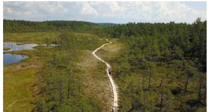
Översikt av en bit av den cirka två kilometer långa spången över Lungälvs mossen.