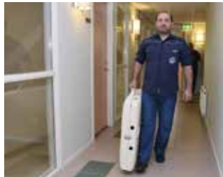
Lourans kan ta med sig massagebänken ut på hembesök.

centrum, men han kan också tänka sig att besöka företag på plats i deras egna lokaler och även att göra hembesök hos privatpersoner som har svårt att ta sig till en lokal.