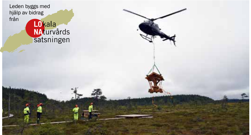
Kalkningsförbundet hjälpte till med helikoptertransport när de var i området.