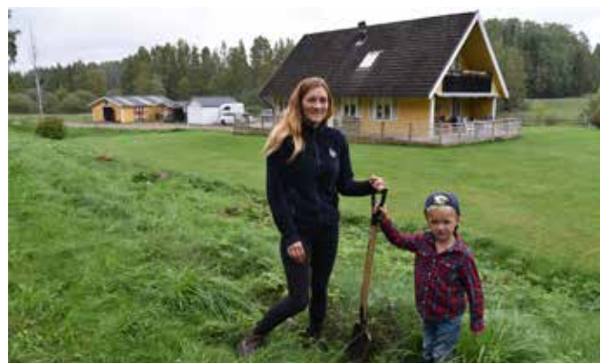
I Dalbäcken har familjen sin trygga bas på gården med stall och hagar.

fler tävlingar och hon satsar nu i ett värmlandslag för fälttävlan.