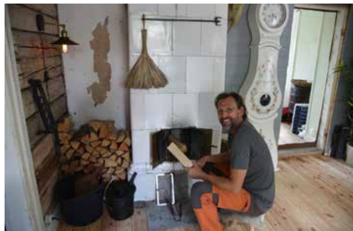
Kakelugn stod också på önskelistan för nya hemmet.