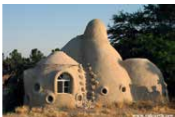
Husen i ekoby är av typen Eco-dome, fantasieggande och vackra.

- Det vore häftigt. Folk kanske skulle vilja vara med och bygga