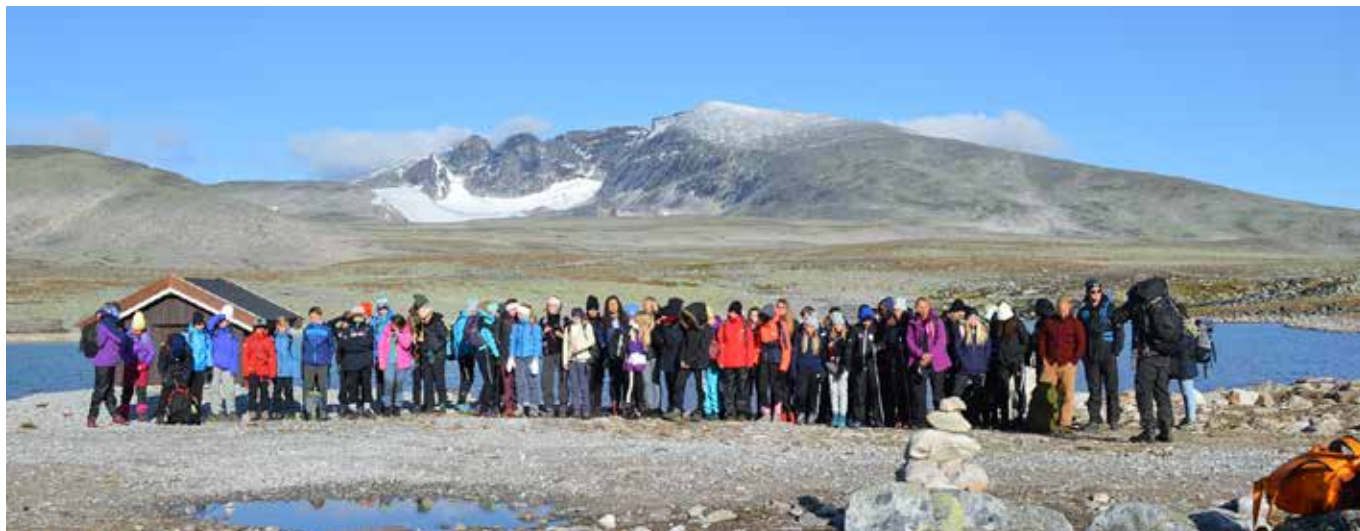
De senaste sex åren har sjundeklassarna i Storfors fått göra en resa till Dovre med fjällvandring, klättring, spaning efter myskoxar och mycket annat. En resa där man bygger relationer för hela högstadietiden.