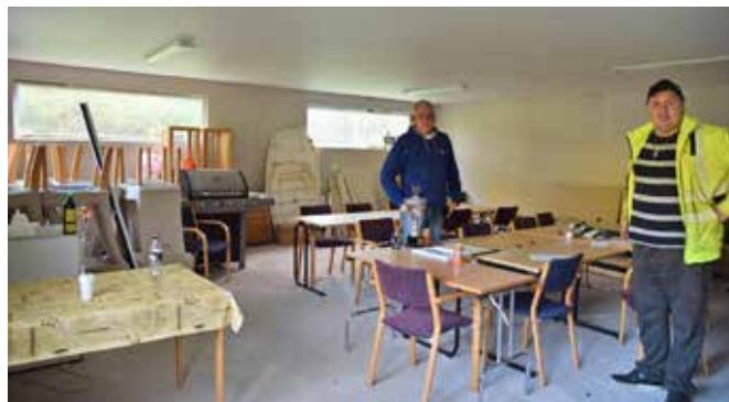
Mycket är redan klart i klubbstugan, men det fattas klinkers på golvet och vävtapeter på väggarna. Huset kommer att ha två toaletter och ett fint kök samt kontor, förråd och stort samlingsrum.