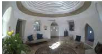
Insidan bjuder på luft och rymd.

en bastu vid pensionatet till exempel, säger han.