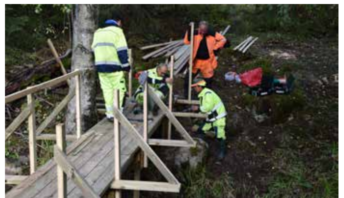
Ett av arbetslagets senaste byggen, en bro över en relativt strid bäck mellan Baksjön och Hyttsjön.