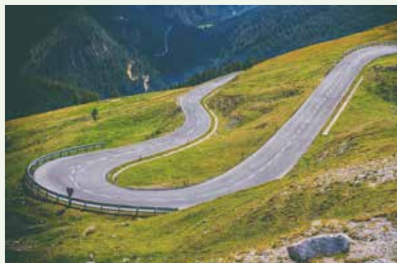
Ibland reser vi på en motorväg, men vi får också färdas på mindre vägar, kanske krokiga och svårare att bemästra.

Vid en av alla dessa fina platser kom min man och jag att prata om att själva