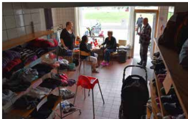
I hyllorna trängs husgeråd med kläder och allehanda prylar.

de får komma till nytta för andra, säger hon.