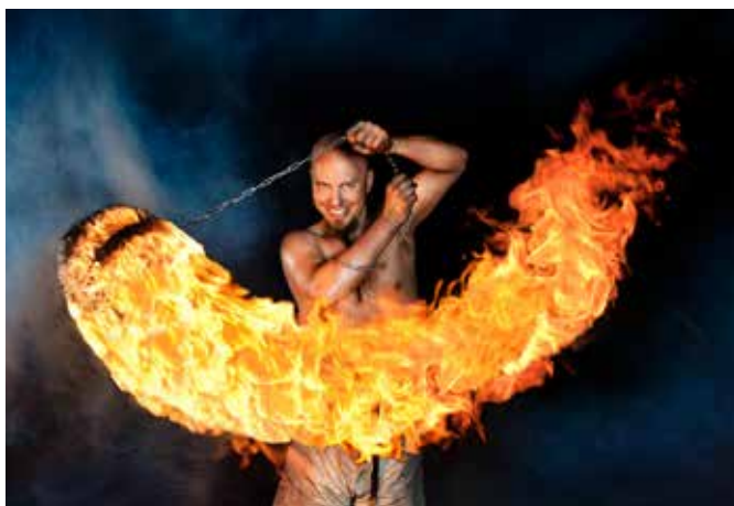
Gycklargruppen Trix bjuder både på eldshow och aktiviteter för barnen.

I nummer 7, den 26 november, kommer hela programmet.