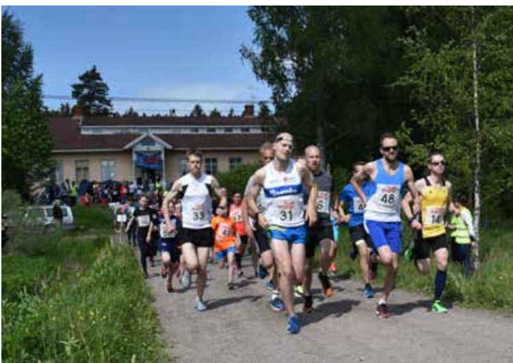
I Bjurtjärn har byalaget startat en ny tradition med Bjurtjärnsloppet. In Bjurtjärn, the village association has started a new tradition with Bjurtjärnsloppet.