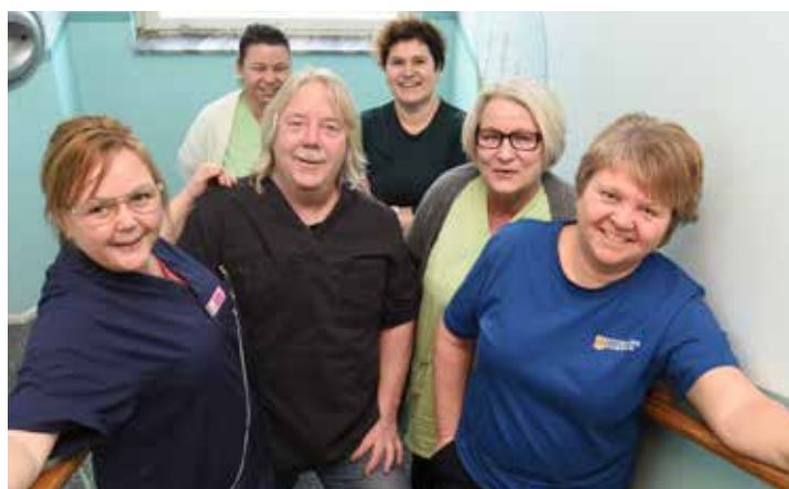
Så gott som alla inom hemtjänsten är undersköterskor. The majority of those working in the home care service are assistant nurses.

den som bestämmer hur en åtgärd ska utföras.