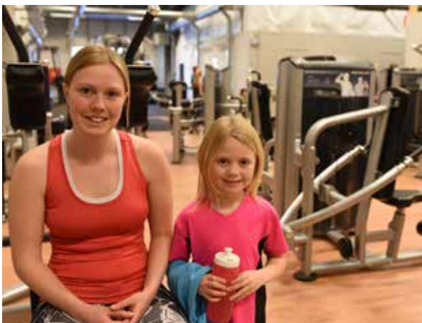
Gymfabriken erbjuder både gruppträning och maskiner. The gym factory offers group training and machines.