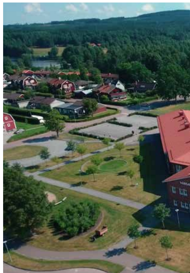
Vargbro skolan ligger vackert intill Mögsjön med närhet till skogen och naturen. Vargbro school is beautifully situated next to a lake, near a forest and nature.

På Forsbro skolan , lokaliserad till Kulturhuset i centrala Storfors, finns SFI, Svenska för invandrare, och Komvux.