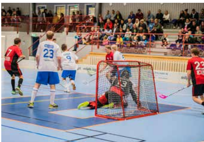
Innebandy spelas i Sporthallen. Indoor bandy.