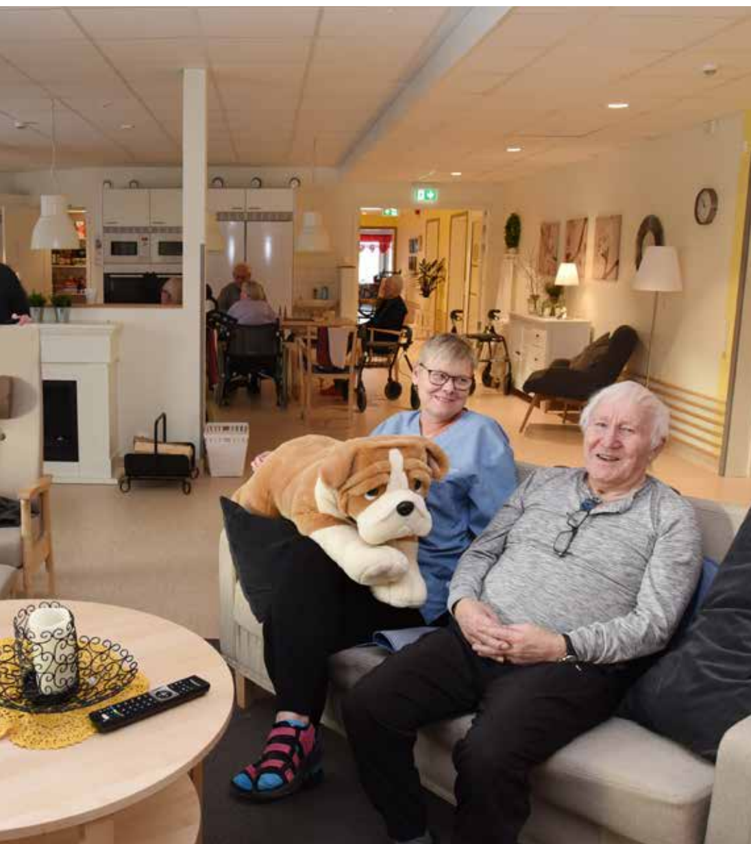
På nybyggda Sjögläntan är det ljust och öppet med varma färger. Newly built Sjögläntan is open, light and decorated in warm colours.

■ The bathrooms are equipped following the Bano concept. This means not only flexible heights but also grip-friendly handles.