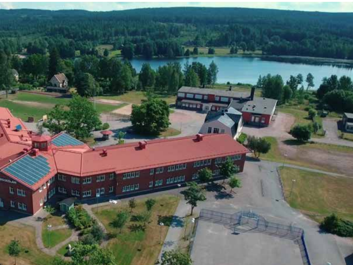
och badplatsen vid Badsta camping som nås via Vargbron. Badsta camping site.