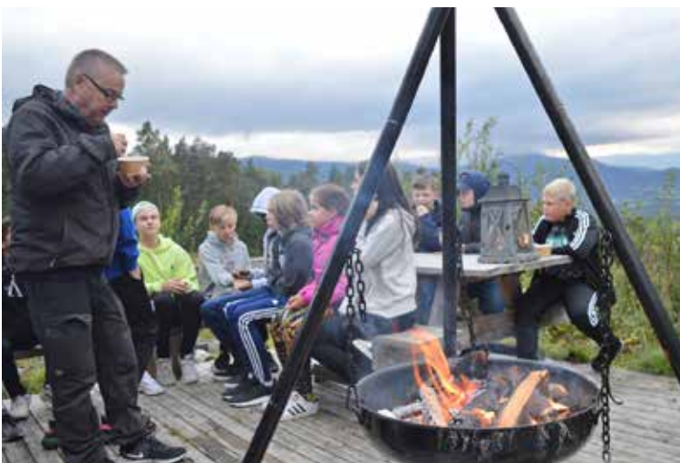
Alla sjundeklassare åker på en gemensam resa i början av högstadietiden. All students starting in class 7 at the secondary school go on a trip together.