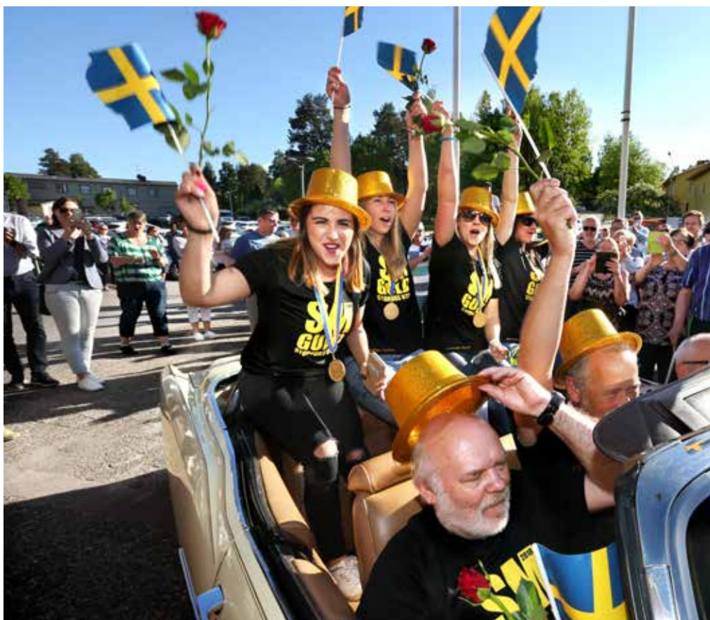
SM-guldet i Pingisligan firades ordentligt i Storfors centrum 2018. SM-guld i the Pingis league 2018.