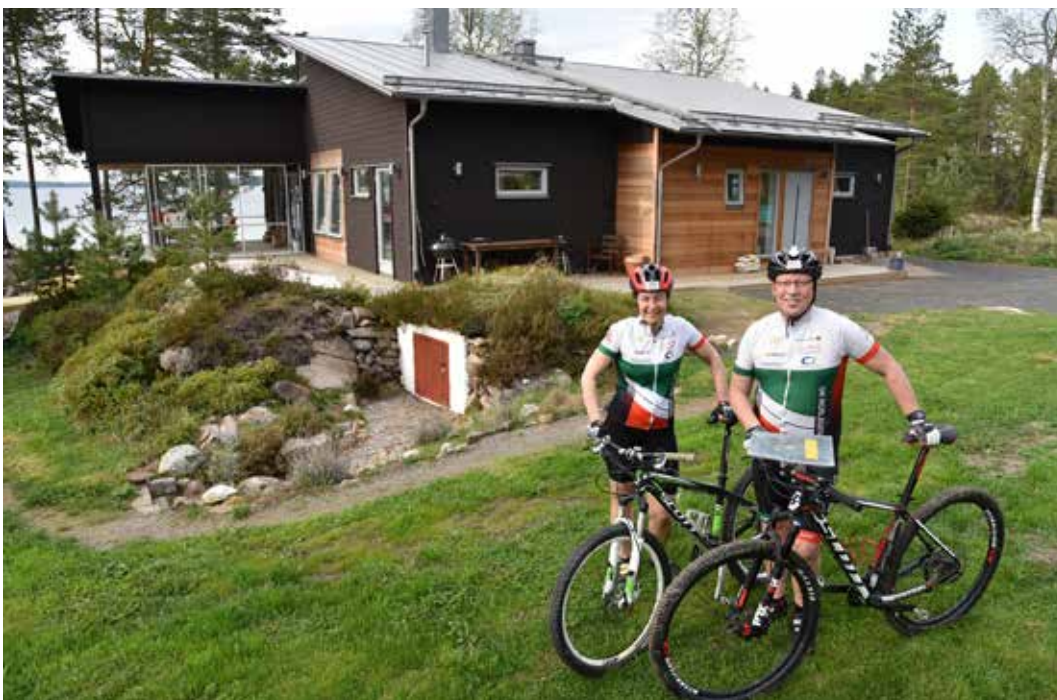
Närheten till naturen passar de idrottande makarna perfekt. Close proximity to nature suits this athletic couple perfectly.