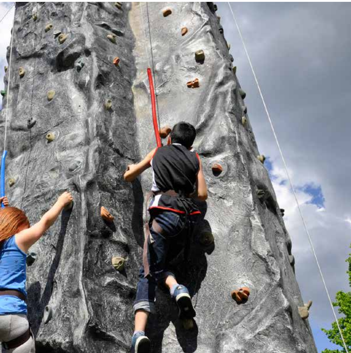
Storfors. Klätterväggen har under några år varit populär.

■ The municipality of Storfors and IOGT-NTO work together to run the recreation centre 'Our House' in Kyrksten. The premises are open several days and evenings a week. There are rooms to meet friends in, table tennis, a gym and a music room that is used by study circles. The leaders also arrange study groups. Tel +46(0)586-10025 or +46(0)70-46 11 628.