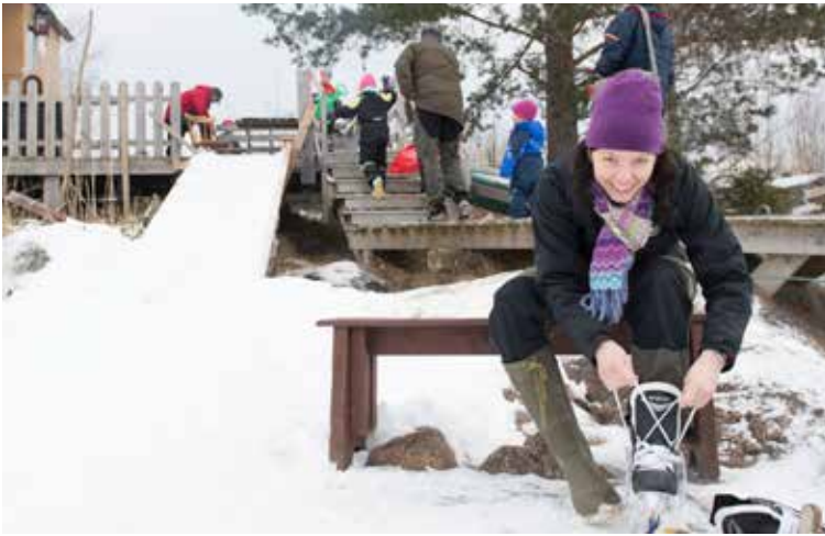
Vintertid lockar de många frusna sjöarna skridskoåkare. In the winter the many frozen lakes attract skaters.