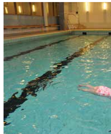
Bassäng. Swimming pool.