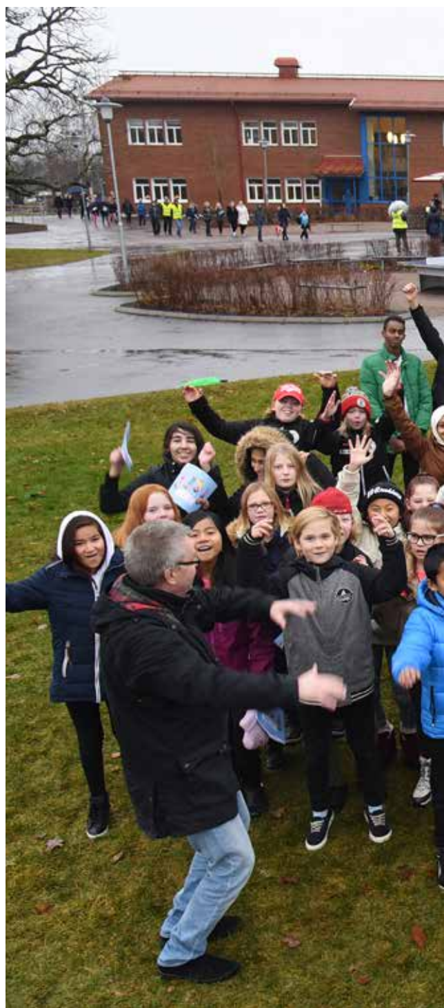
Barnen på Vargbroskolan jublar när Storfors just blivit utsedd till Årets

Vargbro and Bjurtjärn schools always offer a free breakfast. An easy start to the day and a good ground to work on.