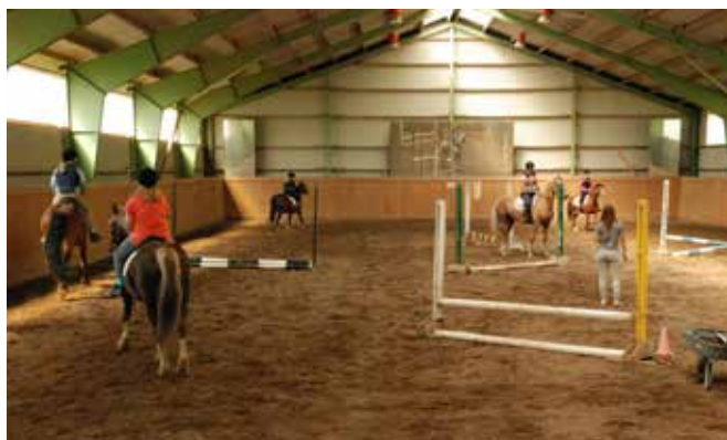
Fint ridhus i Alkvettern. The Riding School.