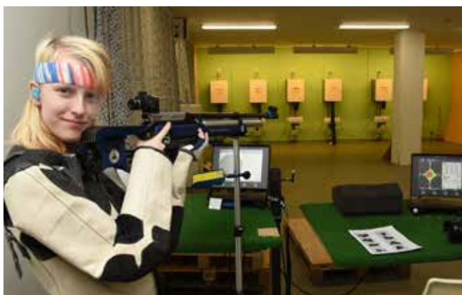
I Storfors finns flera skytteföreningar. In Storfors there are several shooting associations.