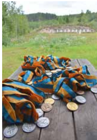
Många medaljer från 2019.

Att få åka Sverige runt och träffa andra likasinnade på