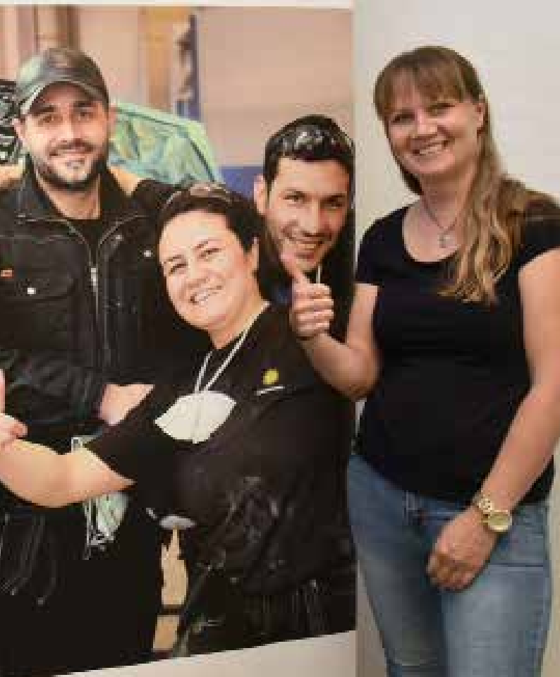
...en att studera ett yrke samtidigt som de läst svenska på SFI.