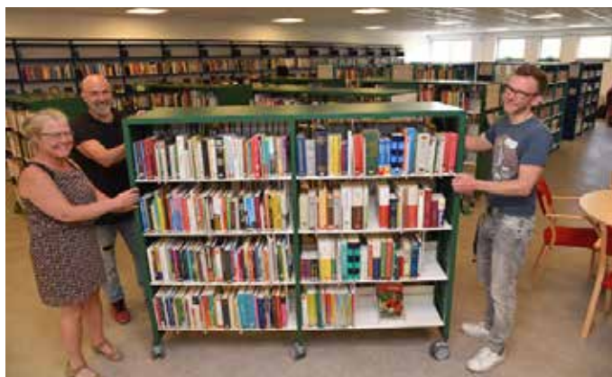
Biblioteket har blivit flexibelt med flyttbara hyllor och nu väntar fler satsningar.

- Vi vill erbjuda folk möjligheten att själva söka och låna de böcker som de är intresserade av. Det är inte alla som vill skylta med vad de läser. Dessutom får vi då mer tid att