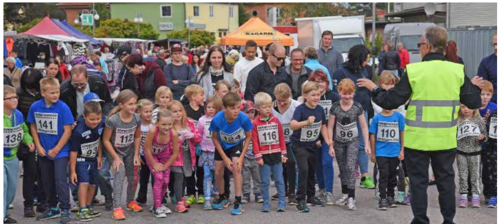
Minijoggen brukar vara ett riktigt populärt inslag i Storforsmärken.

I år kommer även Snickargården att hålla sin köksutställning öppen på Forsbro-