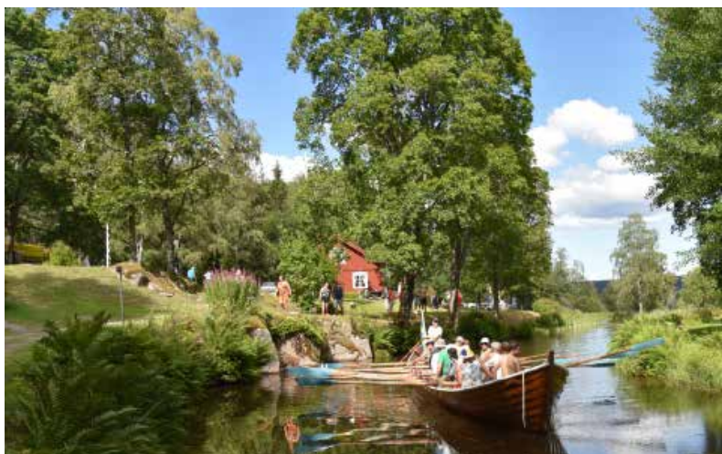
Kyrkbåtsroddarna från Hälsingland lockade en hel del publik.