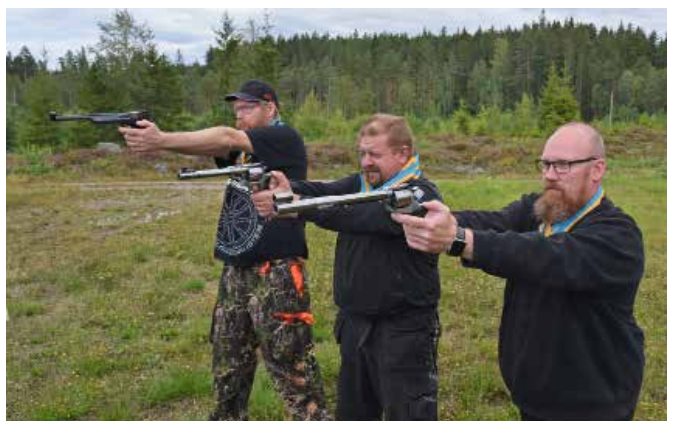
Pistolskytteklubben tränar två gånger i veckan året runt.

På torsdagar är även nybörjare välkomna och klubben har vapen att låna ut.