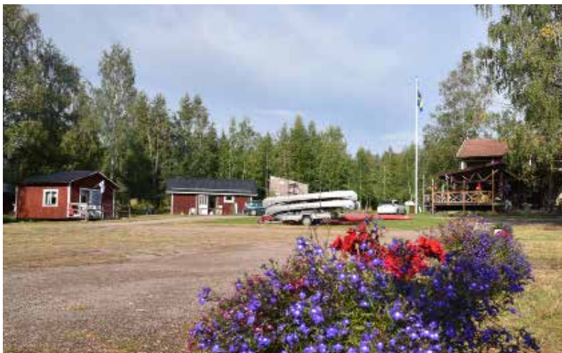
Kanotuthyrningen vid Badsta Camping ökade med tio procent.