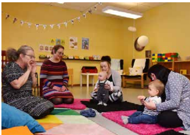
Öppna förskolan bjuder på gemenskap, fika lek, sång pyssel och temadiskussioner.