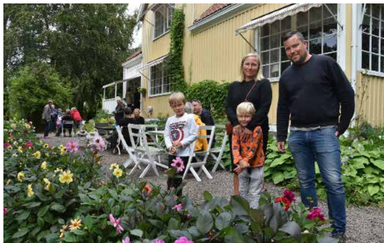
Att hålla trädgården öppen vid fyra tillfällen visade sig vara ett lyckat drag.