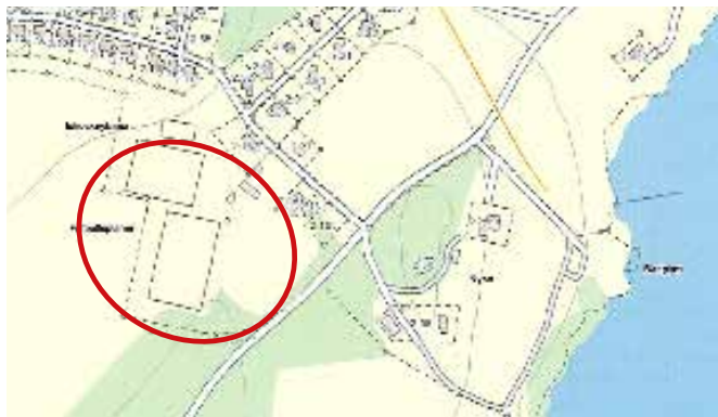
Den nya skolan är tänkt att ligga centralt i Kyrksten.