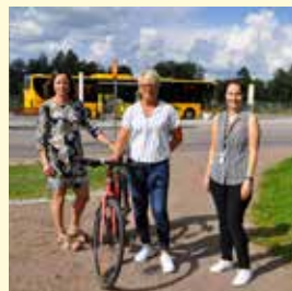
Aktiviteter vid resecentrum 16 september.