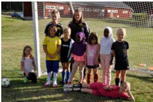
Det kom över 20 yngre tjejer till fotbollsträningen i våras och nu finns ett F8-lag och ett F9-lag.