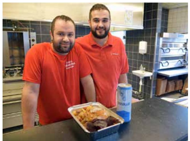
Bröderna Büyükkartal har tagit över Pizzeria Folkets Hus.

Information om utkörning av mat: 0550-600 06.