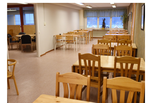
Del av matsalen.