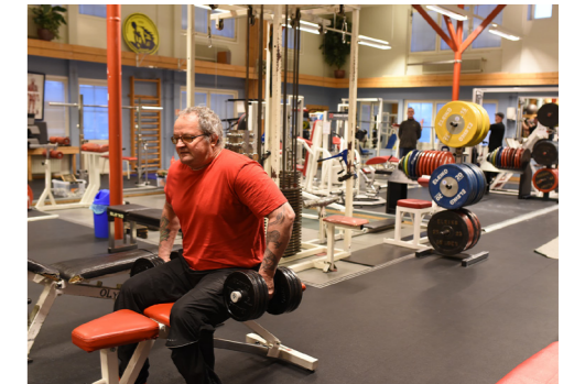
Gym i anslutning till boendet.