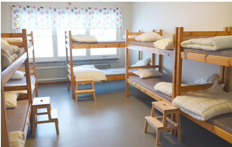
En av de största sovsalarna.

Skiss över boende och matsal. Ytterligare ett rum, ett tvåbäddrum, finns på våning- en under vandrarhemsvåningen (intill matsalen). Konferenssal ligger en trappa ner från matsalen. Judohall, gym och spinningrum ligger en trappa upp från boendedelen.