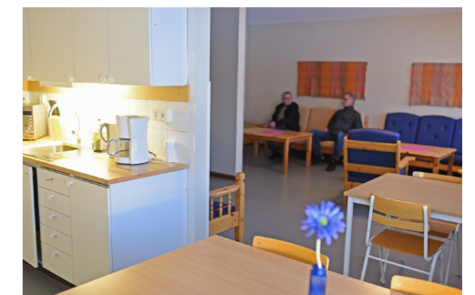
Mindre pentrykök och samlingsal i boendedelen.