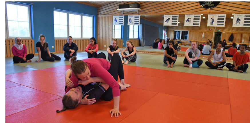
Judolokalen kan användas för träning eller boende på "hårt underlag".