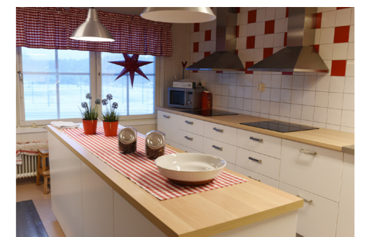
Tillagnings- och serveringskök.