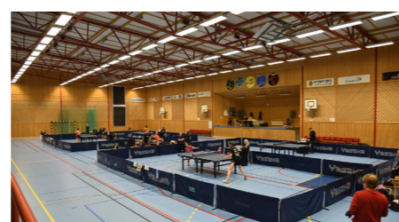
SM-slutspel i Pingisligan spelas här.