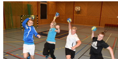
Handbollsklubben har träning för barn.