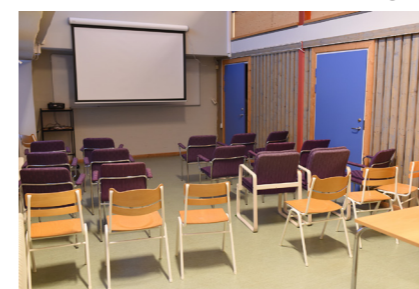
Samling / föreläsning.

Samlingsrum med soffor och bord. Konferensdel för cirka 25-30 personer med duk för projektor och internetanslutning.