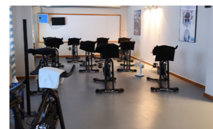
Spinningsal, tio cyklar.