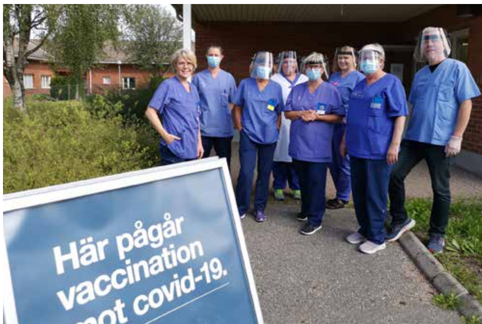
I slutet av augusti arrangerade Region Värmland drop-in-vaccinering i Storfors. Den 14 september kommer man tillbaka för att ge dos två - då finns det också möjlighet att ta dos ett för den som missat det.