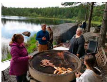
Många ville grilla vid Svarttjärn.