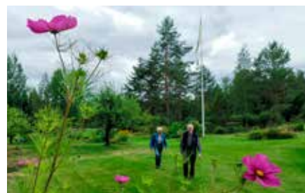
Den stora trädgården har flera spännande avdelningar.