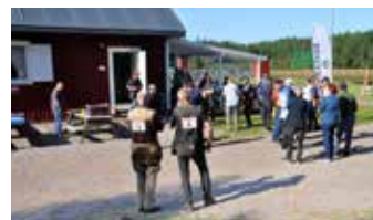
Ett 50-tal skyttar deltog i veteran-SM.

ser det ut som det även kan bli tangerat svenskt rekord!