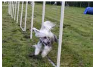
Gabbe klarar slalom galant.