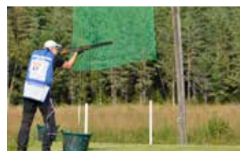
Skeet innebär skytte på lerduvor som kastas från olika håll.