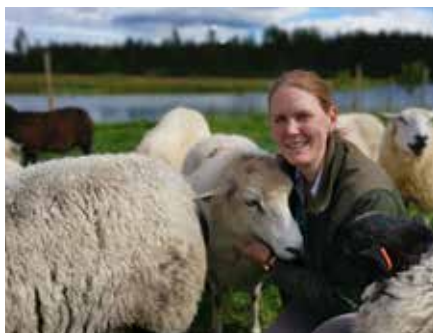
Det finns ett 40-tal får och lamm på gården.