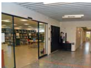
Foajén ska bli en naturlig del av biblioteket.