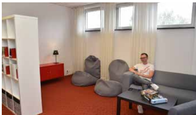
Ett ungdomsrum med spel och utvald litteratur finns nu klart.

Det nya systemet innebär att man kan låna böcker och att man kan använda datorer och wifi även utanför de ordi-