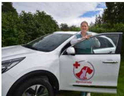
Den 10 september öppnar bokningen i det nystartade företaget.