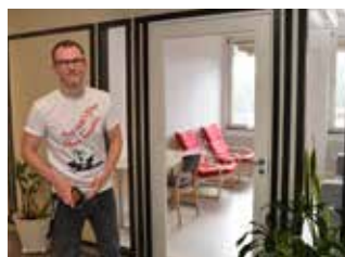
Två studierum är klara och väntar på möbler.