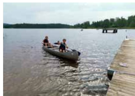
Många passade på att paddla.