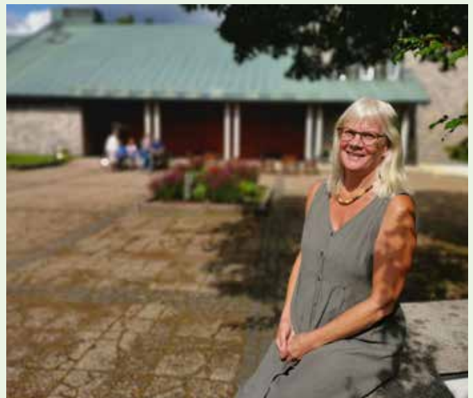
Att få jobba med vuxna blev en ny och positiv erfarenhet efter många trivsamma år som församlingsassistent för barn och unga.

- Vi har träffats en gång i veckan och bland annat provat hantverk och annat som gett livsglädje till kropp och själ, säger hon.