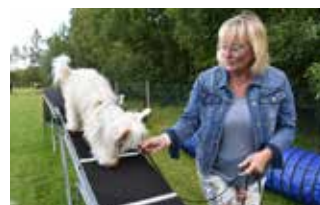
Besökarna fick öva agility.