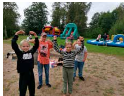
Glada deltagare vid Badsta.