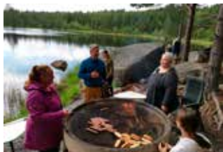
Ett besök vid kommunens sommarlovsaktiviteter.