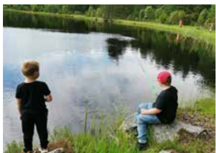
Det fanns gott om plats vid tjärnen.

- Det här är mycket roligare än att sitta inne på lovet, skrattade Tilde. EVA WIKLUND