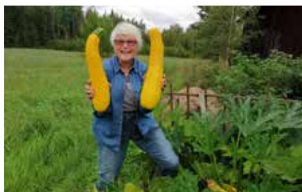
Odlingarna innehåller mångahanda grönsaker som visar god växtkraft.