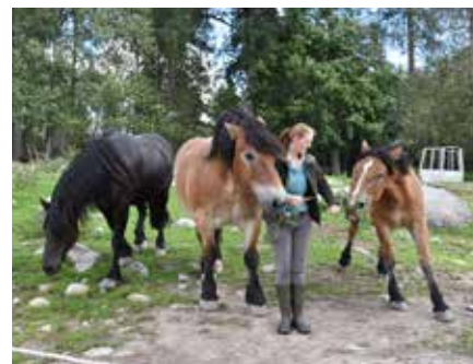
De två ardennerhästarna och det österrikiska halvblodet används i jordbruket.