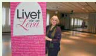
Inför arrangemanget Livet vårt att leva.