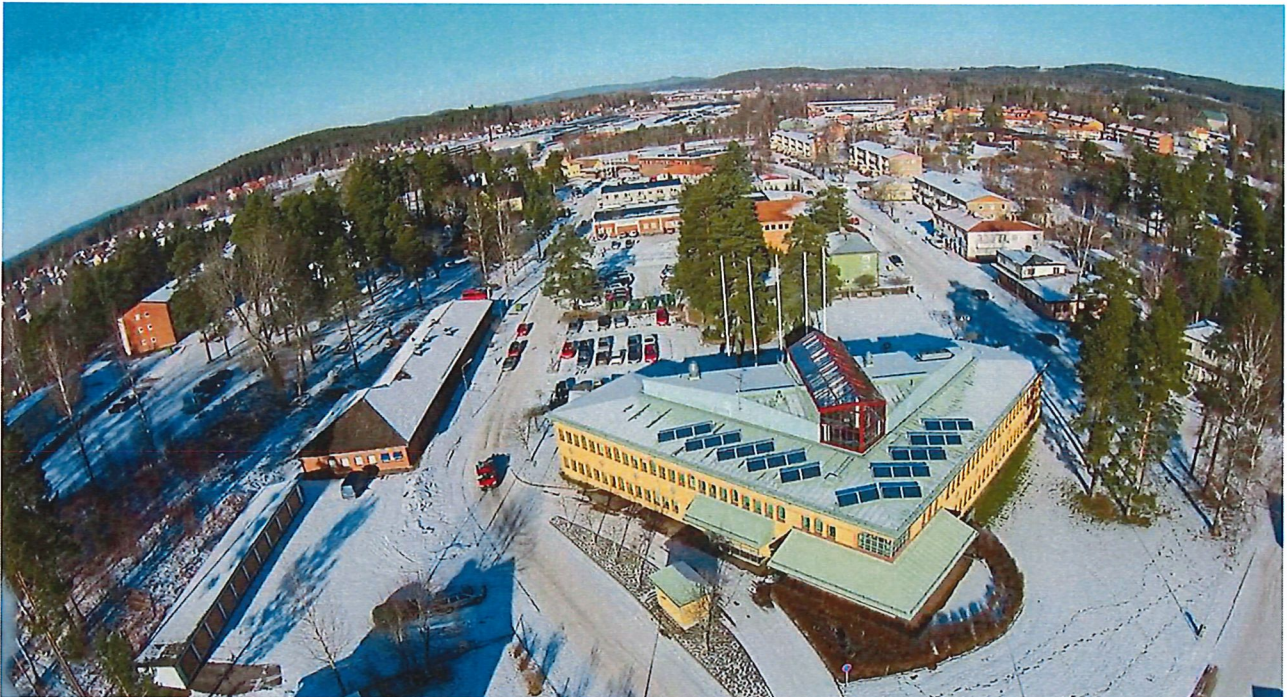
Foto: Storfors kommuns kommunhus

Resultatet skall skapa en god säkerhetskultur för kommunens verksamheter. Storfors kommuns risk- och sårbarhetsanalys ska ge en övergripande bild av riskobjekt och sårbara verksamheter inom kommunens geografiska yta. Sammanställningen ska användas i arbetet med att ta fram åtgärdsförslag.